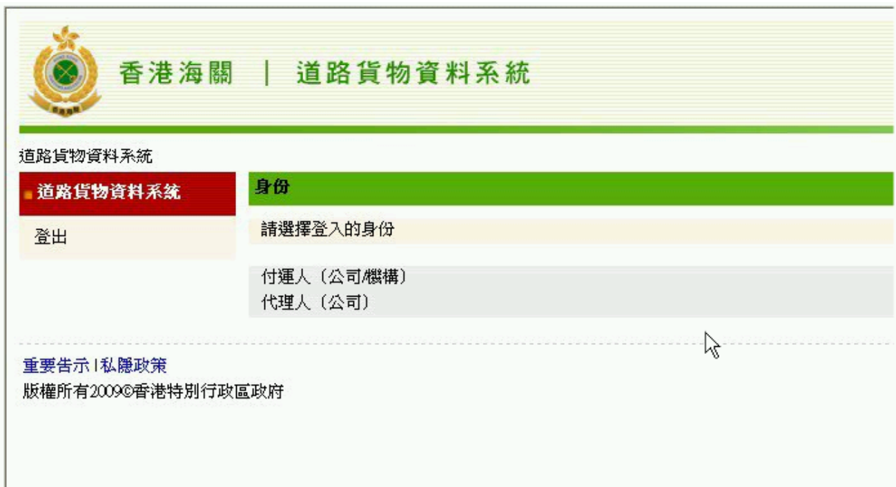
圖表 3: 登入 ROCARS 系統 - 選擇已登記之身份 (Role) 頁面