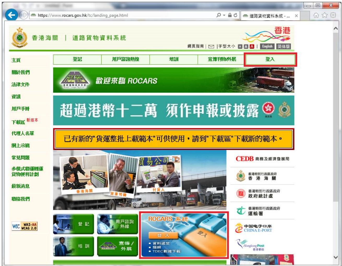
圖表 1: 登入 ROCARS 系統 – 主頁