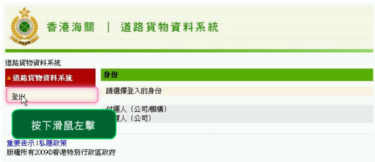
圖表 4: 登出 ROCARS 系統