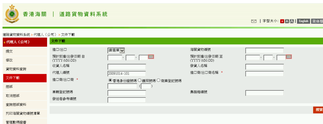
圖表 2: ROCARS 系統 - 文件下載搜索頁面